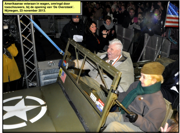
Amerikaanse veteraan in wagen, omringd door toeschouwers, bij de opening van 'De Oversteek'. Nijmegen, 23 november 2013.