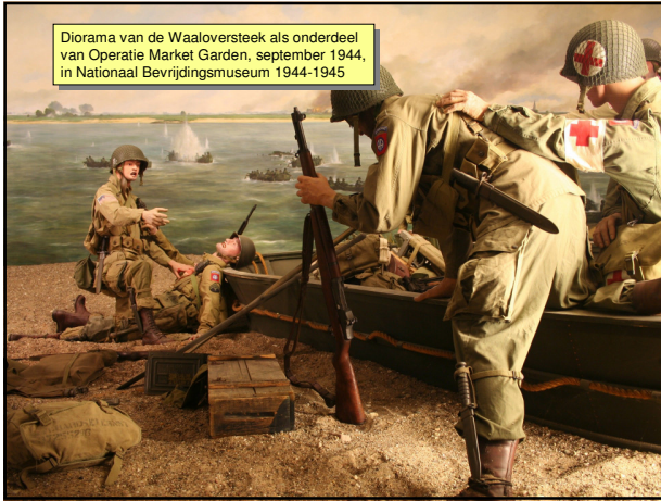
Diorama van de Waaloversteek als onderdeel van Operatie Market Garden, september 1944, in Nationaal Bevrijdingsmuseum 1944-1945